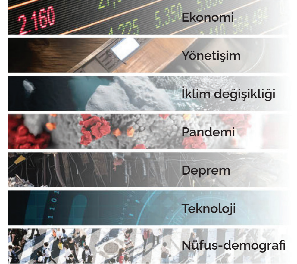
Şekil 13: İstanbul'da Hareketliliği Etkileyen Dış Etkenler

Her biri İstanbul için çok önemli konular olan bu etkenlerin bazıları diğerlerine göre daha fazla ön plana çıkmaktadır. Örneğin nüfus, gelecek kestirimleri mevcut değişimlere göre yapılabilen ve eğilimleri öngörülebilir bir etkidir. Bunun yanı sıra, iklim değişikliği varlığını sürekli olarak hissettiren ve süreklilik gösteren bir etkidir. Pandemi, iki yıla yakın süredir her alanda ve sektörde önemli değişikliklere yol açmışken, deprem kentin kaçınılmaz bir gerçeği olarak varlığını sürdürmekte, teknoloji ise birçok endüstriyel ve ticari alanda etkisini artırmaya devam etmektedir. Sayılan dış etkenlerin ortak özelliği, bunlardaki eğilim ve değişimin görece daha öngörülebilir olmasıdır. Bu dış etkenlerin aksine, ekonomik refah ve yönetim sistemi, en belirsiz ve öngörülmesi en zor olan alanlardır. Bu nedenle, bu etkenler İstanbul'un gelişimi için iki kritik belirsizliği temsil etmektedir.